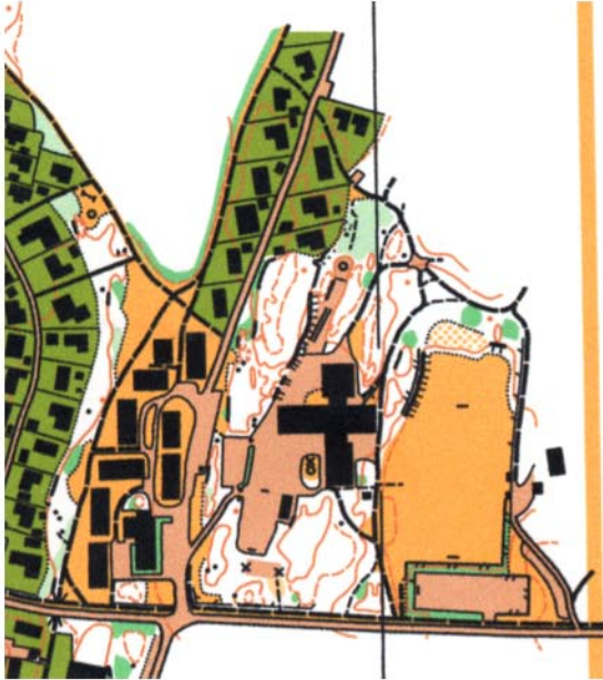
Karteksempel: Hannestad-Tinlund, Sarpsborg OL

Fellesstart og en fastsatt tid på oppgaven.